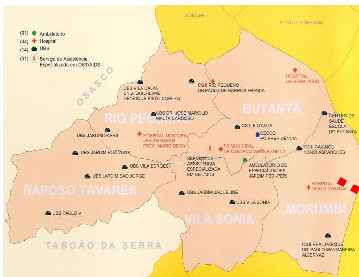
Distrito de Saúde do Butantã

O Distrito de Saúde do Butantã integra a Coordenadoria de Saúde Centro-Oeste da Secretaria Municipal de Saúde de São Paulo. É composto por uma rede integrada de serviços públicos, incluindo as unidades básicas de saúde (UBS) Boa Vista, Vila Sonia, Vila Nova Jaguaré, Paulo VI, Jardim São Jorge, Vila Dalva, Vila Borges e Jardim Jaqueline. Conta ainda com uma unidade escola – o Centro de Saúde Escola Samuel B. Pessoa, um ambulatório de especialidades e dois hospitais, um deles o Hospital Universitário da USP. Responde pelo atendimento de 377.576 pessoas. Conta com um Conselho Técnico Gerencial, com delegados da SMS e das unidades-escola para planejar e acompanhar as atividades de ensino, pesquisa e assistência desenvolvidas.