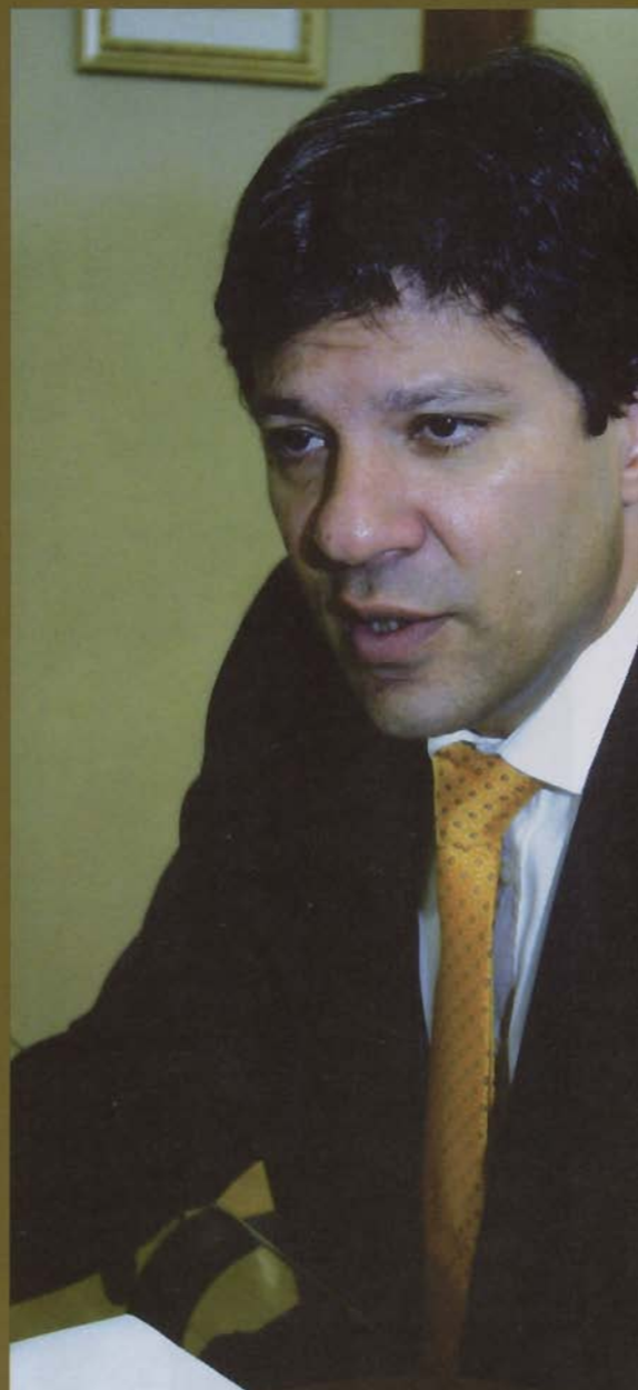
Fernando Haddad - No início os ministérios da Educação e da Saúde eram um mesmo - o Ministério da Educação e Saúde Pública. E como é natural na máquina pública, quando as funções do Estado se tornam mais complexas, esses órgãos administrativos passam a gozar de autonomia e status ministerial. Embora essa mudança tenha ocorrido sobretudo com a criação do SUS, já era percebida nos anos 50, quando o ministério foi desmembrado. É natural, como aconteceu com a cultura, com o esporte e com a saúde, só que isso não podia ser visto como uma quebra de unidade. A unidade entre educação e saúde precisa ser recuperada, resgatada. O MEC e o Ministério da Saúde passaram muitos anos sem um diálogo profícuo em torno das questões comuns, sobretudo envolvendo a questão da formação de profissionais da área da saúde. A própria residência médica é a expressão dessa necessidade, por se tratar da formação no trabalho, o que significa dizer que na residência essas duas coisas são até indissociáveis: é o exercício profissional, porque o médico já está formado, e a formação do especialista. Nós estamos em busca da unidade perdida criando essa comissão interministerial, que tem justamente como prerrogativa subsidiar os ministérios para que avancem nas suas ações e programas, compatibilizando as perspectivas que cada setor tem. É de suma importância a existência da comissão, porque todo esse trabalho de aproximação entre a saúde e a educação, que surge com mais força a partir de 2004, passa a gozar de uma institucionalidade. As conquistas dos últimos três, quatro anos, na interlocução entre os ministérios, ganha um espaço institucional privilegiado, dando consequência ao disposto no capítulo da saúde da Constituição e dando consequência ao disposto no capítulo da educação na Constituição. Nós estamos compatibilizando essas perspectivas.

FH - Na verdade a ação mais importante nessa área de adequação dos projetos político-pedagógicos às diretrizes curriculares aprovadas no Conselho Nacional de Educação tem sido promovida